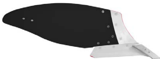
Nuovo corpo n. 14 di Kverneland, in plastica.

04.02.2015, Castiglione delle Stiviere, Italia